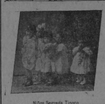
Niños Segredá Tinoco

¿Veis esa muñeca que está allí lista, prendida de veinticinco alfileres, pronta á salir de paso en compañía de cualquiera señorita de tres á cinco años de edad? Ella es la invitadora. Vedle el caballito arreglado en ondas, el sombrero colocado de manera que el sol no aje sus rodadas mejillas, el trapecio brillante, como de quien quiere ir á una conquista amorosa. La mirada acariciadora, los labios entreabiertos y rojos, las manecitas tendidas como diciendo: «élévenme por Dios».